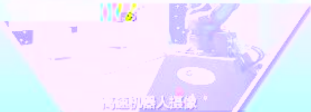
高精度机器人摄像